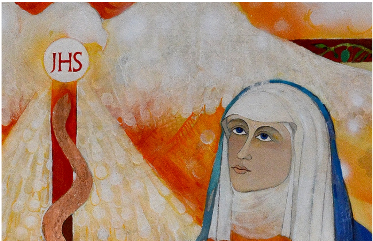
Máriin pohľad (detail)